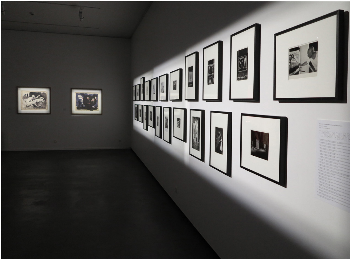
Vue d'exposition, 2018, Salle 5, photographies de tournage du Mystère Picasso et calques originaux provenant du film, © Musée Bernard d'Agesci, Niort et Communauté d'Agglomération du Niortais.