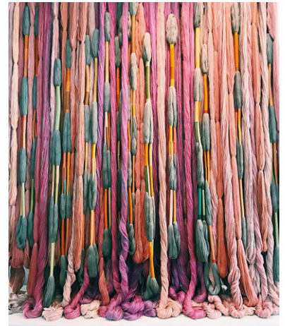
Sheila Hicks, exposition Lignes de vie , 2018, Centre Pompidou, Paris, © Talia Elbaz.